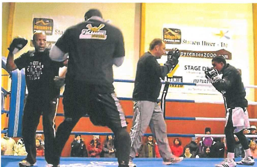
Des démonstrations à voir aujourd'hui à l'académie.