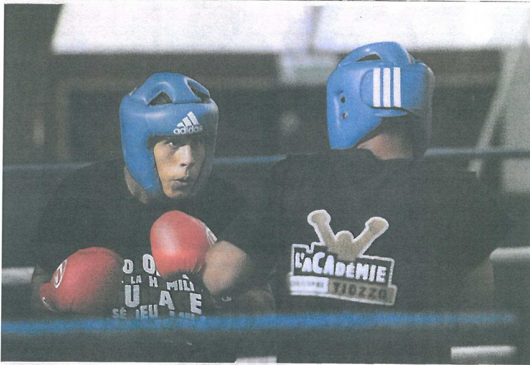
Cet été, 17 jeunes boxeurs ont participé au stage organisé par l'Académie Christophe Tiozzo.